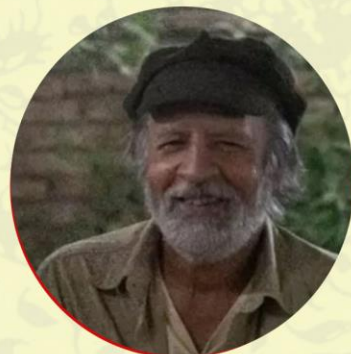
محمد تقی فهیم